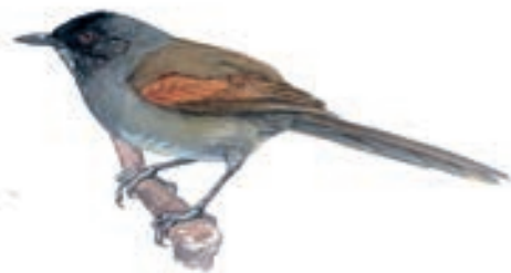
Cola-Espina de Cabeza Negra Synallaxis tithys

Para llegar con tiempo suficiente a Huabal, y no perderse del amanecer, la partida fue en la tarde del 13 de mayo desde la ciudad de Piura, el recorrido es de aproximadamente 2,5 horas hasta San Miguel de El Faique o Canchaque. Desde aquí, el bosque queda muy cerca, y en 20 minutos estás en el mejor punto de observación. Así, muy temprano en la mañana del 14 de mayo empezó el conteo en Huabal