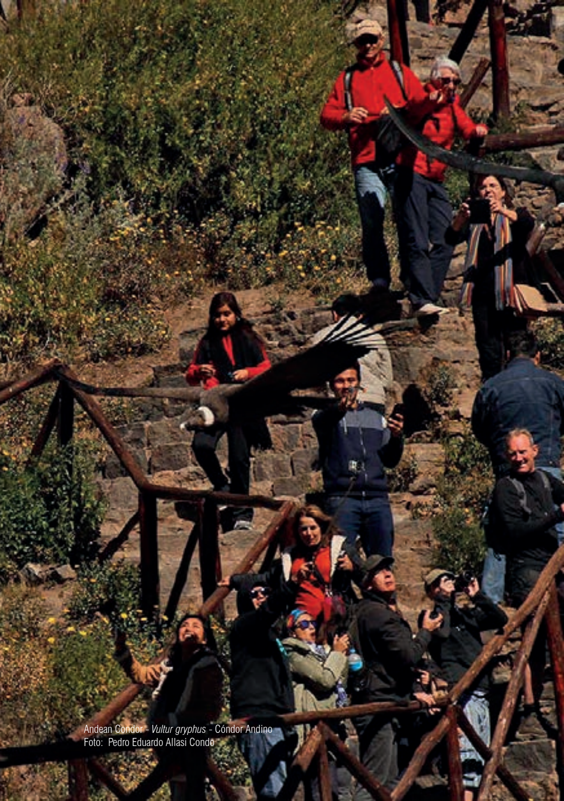
Andean Condor - Vultur gryphus - Cóndor Andino