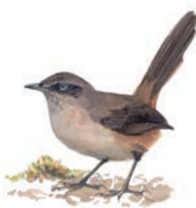
Canastero de Pecho Cremoso Asthenes dorbignyi

El GBD para este grupo empezó a las 07:20 horas y terminó a las 12:00 horas. La caminata de observación se realizaron en dirección hacia "Muyurina" (valle agrícola-recreacional) desde el sector de "Mollepata" ubicado al norte de la ciudad de Ayacucho con dirección al valle del río "Muyurina", pasando por una zona Xerofítica.