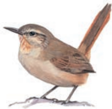
Canastero de los Cactus Pseudasthenes cactorum

El GBD para los canasteros empezó a las 7:15 horas y se prolongó hasta las 12:00 horas. El acceso a la Reserva nacional de Lachay es por vía terrestre. Se toma la carretera Panamericana norte hasta el kilómetro 105 donde está el desvío hacia el interior de la reserva, que es un camino de tierra afirmada de unos 7 kilómetros que llega hasta la sede administrativa.