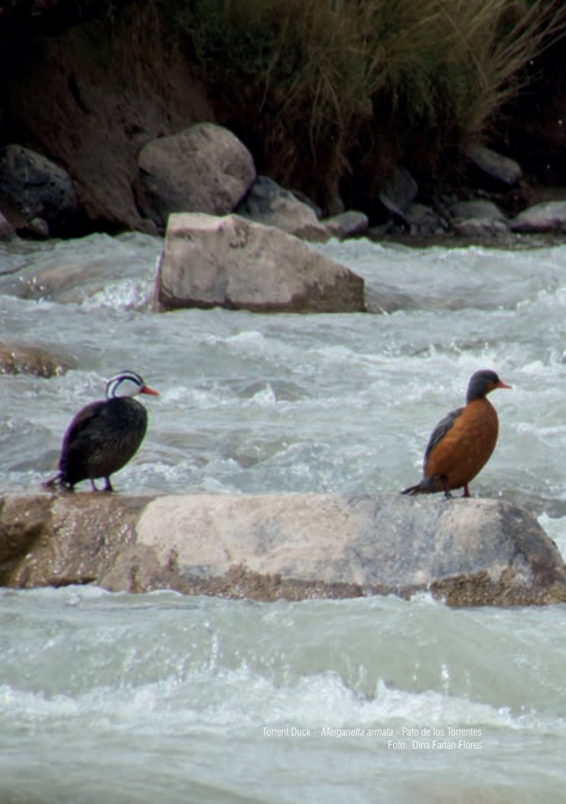
Torrent Duck - Merganetta armata - Pato de los Torrentes