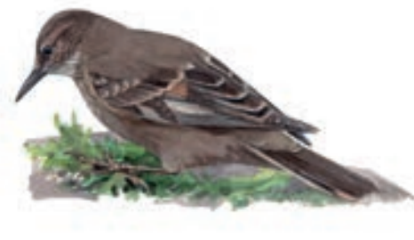
Churrete Marisquero Cinclodes taczanowskii

El GBD para este grupo de jóvenes ornitólogos empezó a las 05:45 horas y terminó a las 11:30 horas. Su recorrido incluyó el dormitorio de cóndores, la ensenada de San Fernando, acantilados, lomas, el estuario y bosque ribereño del Río Grande y finalmente, algunos campos de cultivo cercanos.