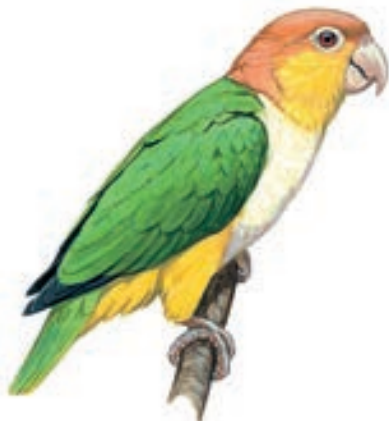
Loro de Vientre Blanco Pionites leucogaster