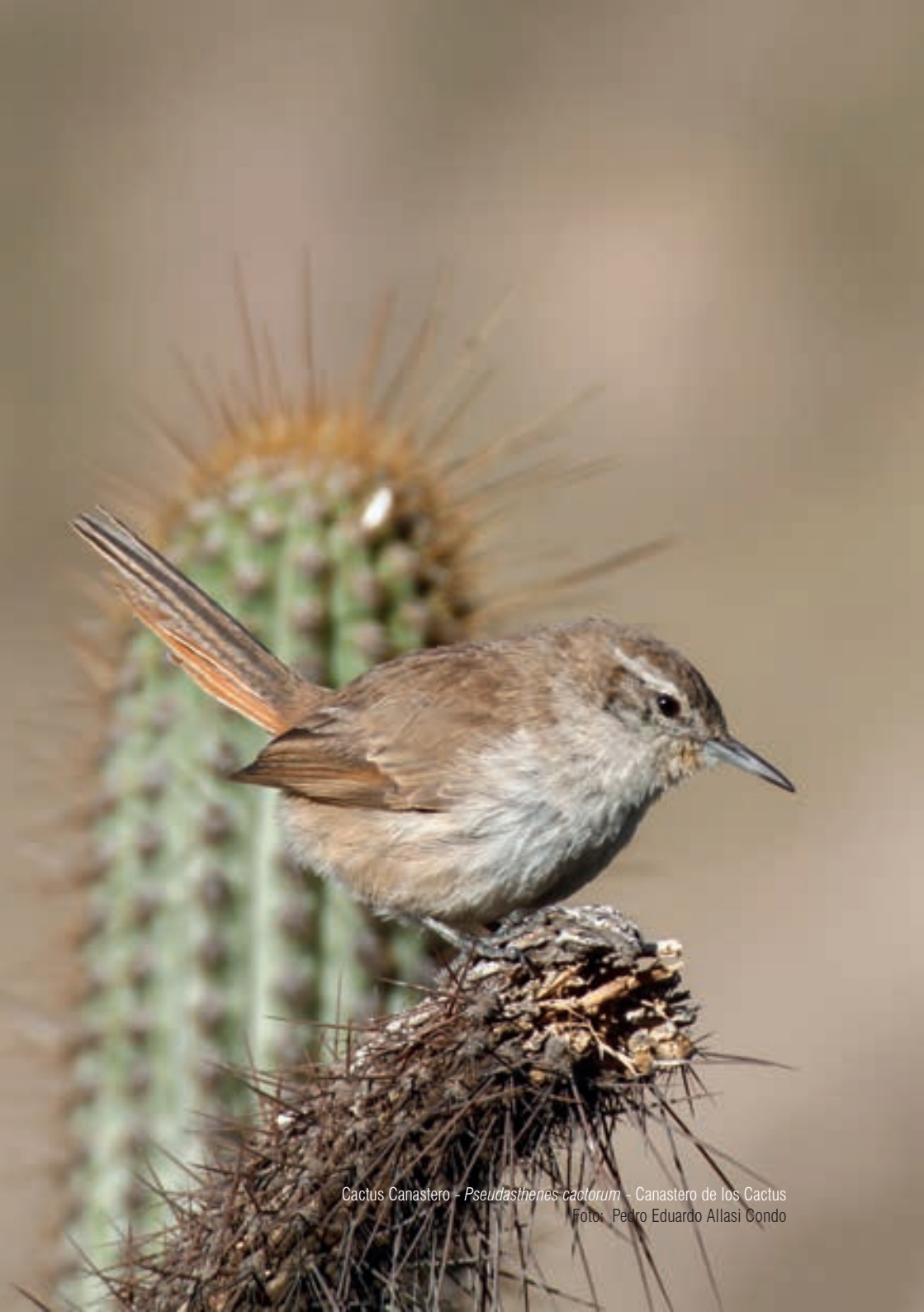
Cactus Canastero - Pseudasthenes cactorum - Canastero de los Cactus