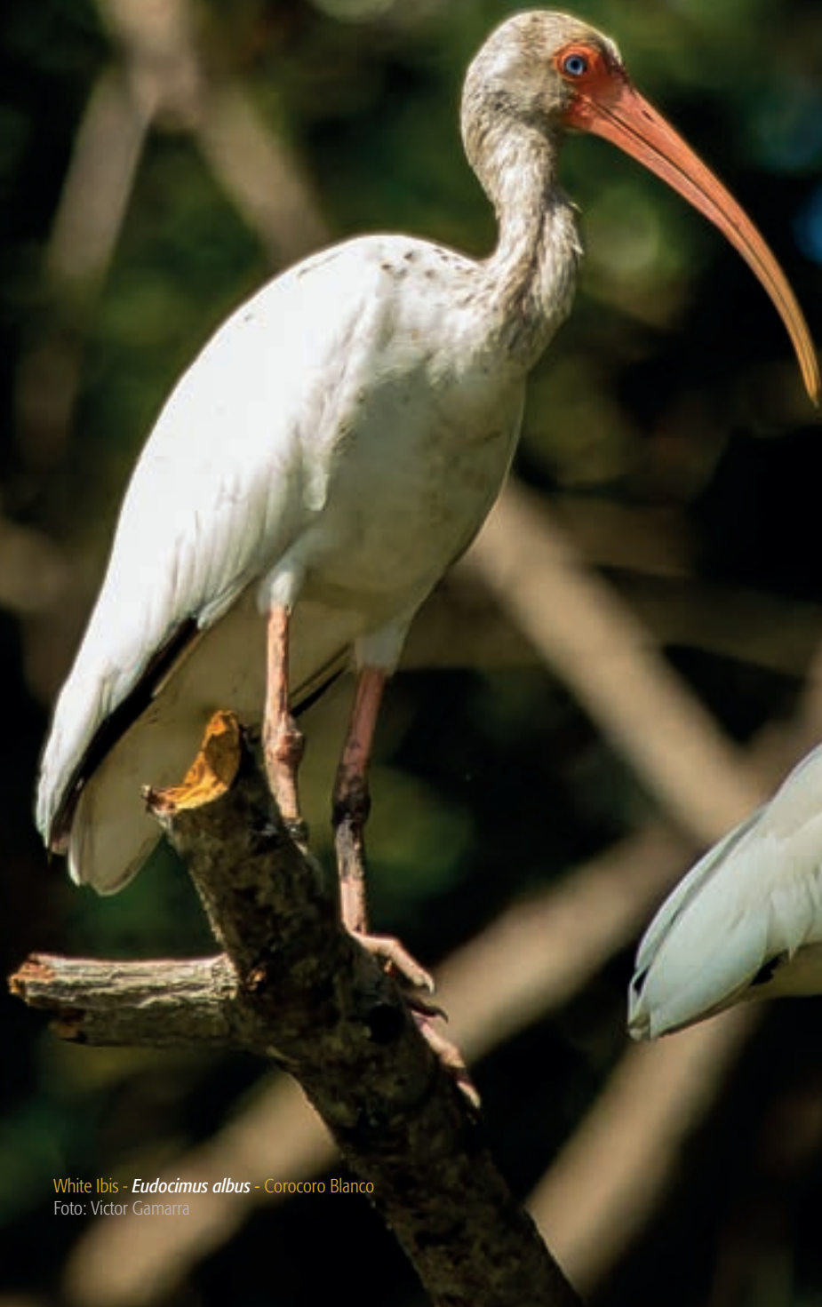
White Ibis - Eudocimus albus - Corocoro Blanco