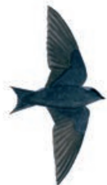
Martin Peruano Progne murphyi