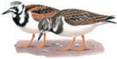
Vuelvepedras Rojizo Arenaria interpres

Los GAP - Lambayeque, empezamos el GB, a las 05:00 horas y estuvimos viendo aves en el bosque seco hasta las 17:00. las observaciones empezaron en el Rinconazo y continuó en los humedales de Puerto Etén.