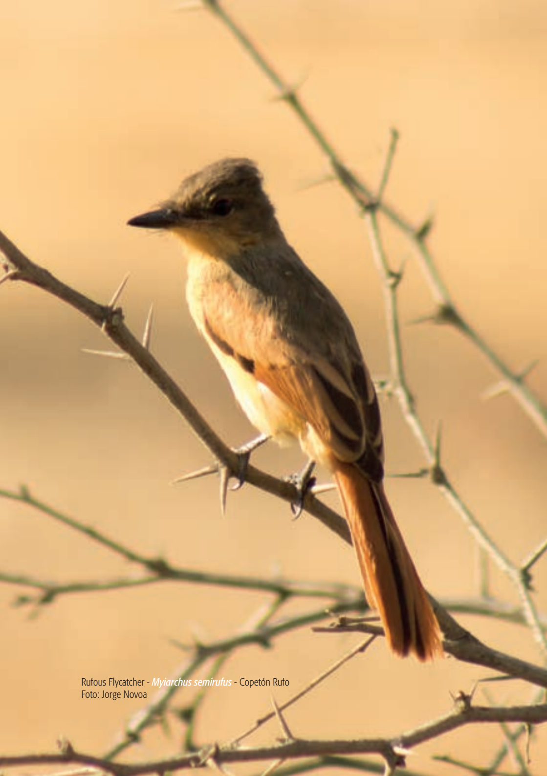
Rufous Flycatcher - Myiarchus semirufus - Copetón Rufo