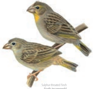
Sulphur-throated Finch Sicalis taczanowskii

El GBD empezó a las 5:45 am en el bosque seco hasta las aproximadamente las 12 pm y por la tarde, después de almorzar y reponer energía en Las Chereelas Fishing & Adventure Club continuamos las observaciones en las playas cercanas y humedales hasta las 18 horas aproximadamente.