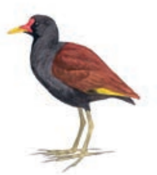
Gallito de Agua de Frente Roja Jacana jacana

El 14 de mayo, desde la 1 a 3 am empezamos a ver aves, pero llegadas las 6:30 am comenzó la búsqueda intensiva. Se recorrió todo el humedal, y algunos campos agrícolas cercanos,