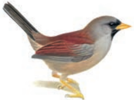
Fringillo-Inca de Dorso Rufo Inca spiza personata