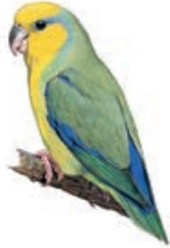
Periquito de cara amarilla Forpus xanthops

El GBD para el grupo 2 de los cajachos Birders empezó a las 5:50 horas y se prolongó hasta las 18:15 horas. En su recorrido visitaron la curva Santa Rosa, Brasilmayo, el Limón, Chorpata hasta llegar al valle del Marañón.