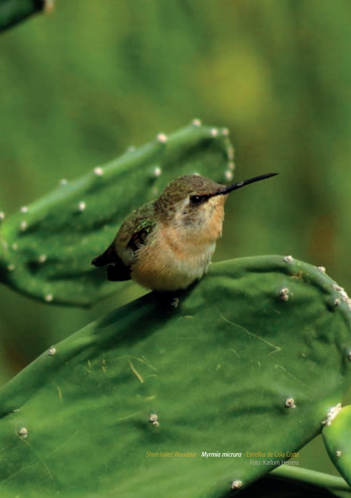
Short-tailed Woodstar - Myrmia micrura - Estrellita de Cola Corta