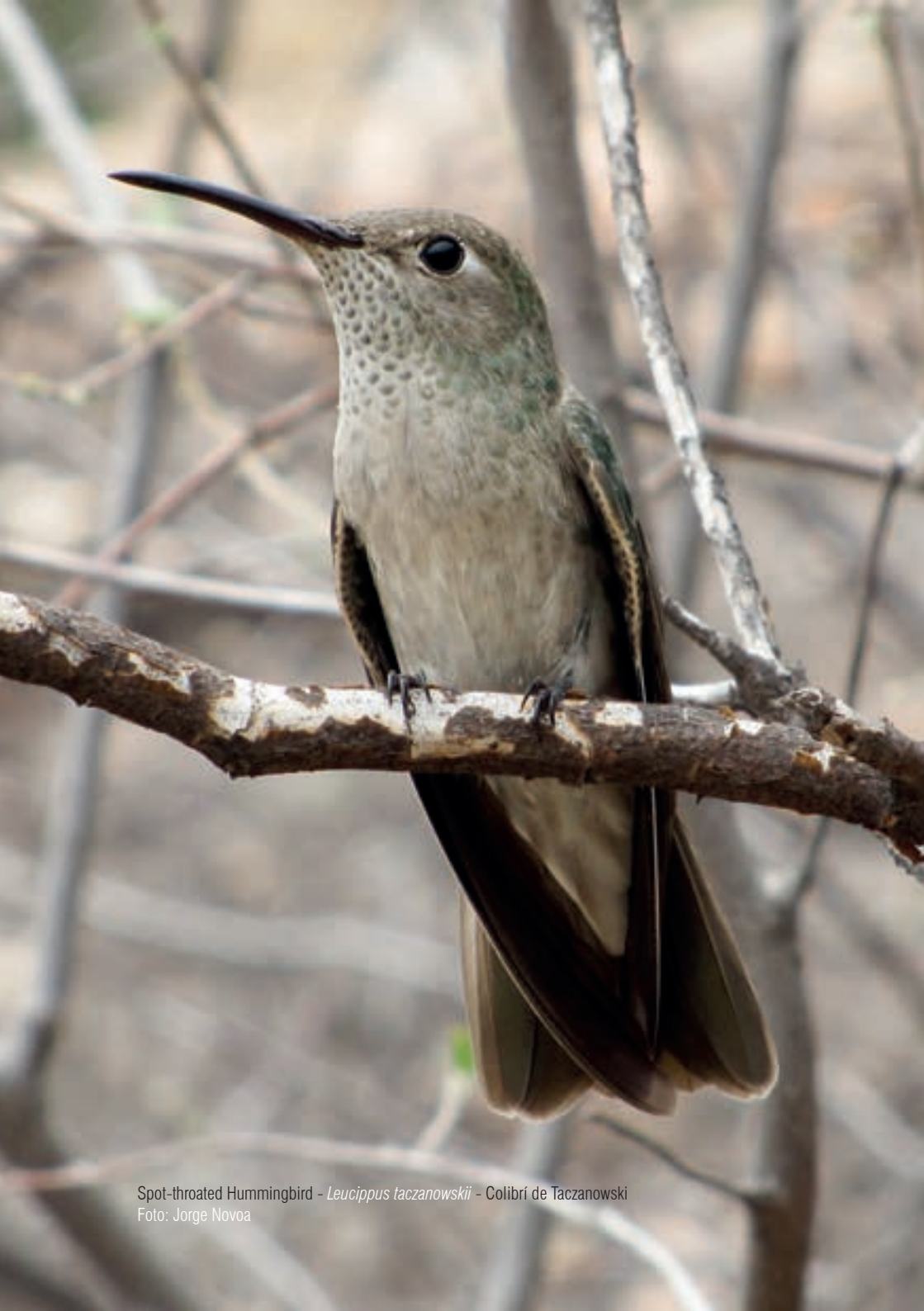
Spot-throated Hummingbird - Leucippus taczanowskii - Colibrí de Taczanowski