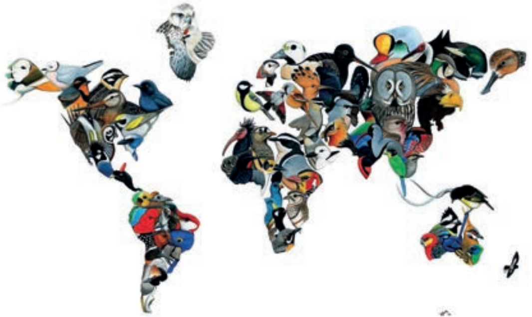
Global Big Day por Luke Seitz

de 24 horas, se ven entre 50 y 229 especies, con un promedio de 166 especies. Uno de los equipos participantes, al menos desde el año 1998, es un equipo de Cornell. En esa época ganaron el título de más especies vistas por un equipo de no-residentes de Nueva Jersey, con 190 especies. Equipos de Cornell siguen participando seriamente, estando siempre entre los primeros.