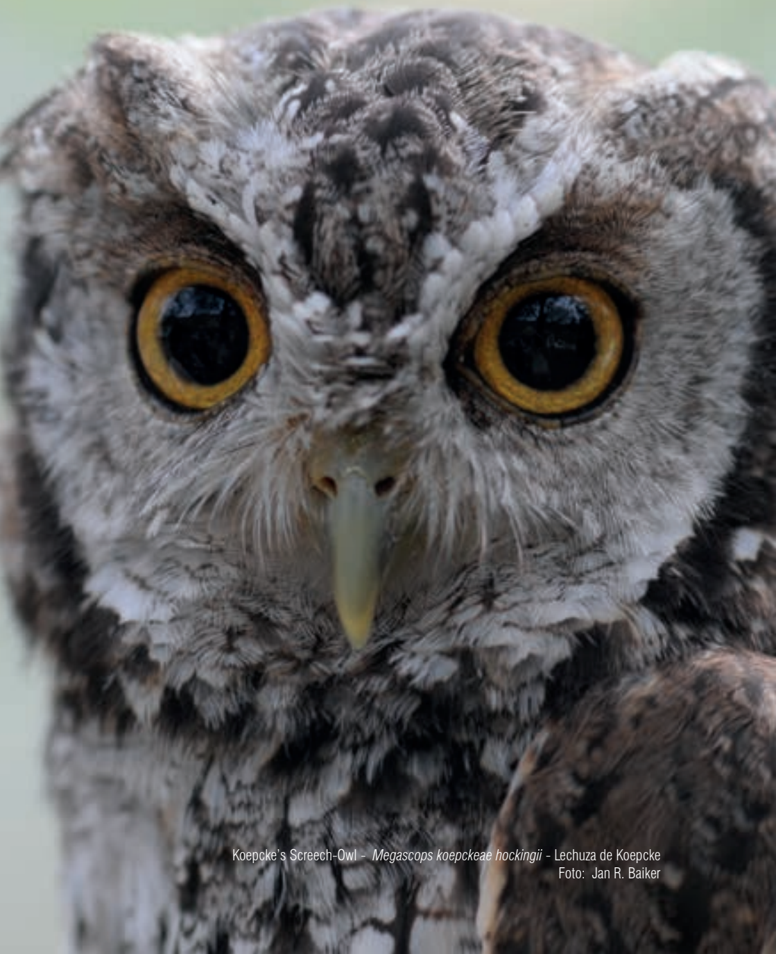
Koepcke's Screech-Owl - Megascops koepckee hockingii - Lechuza de Koepcke