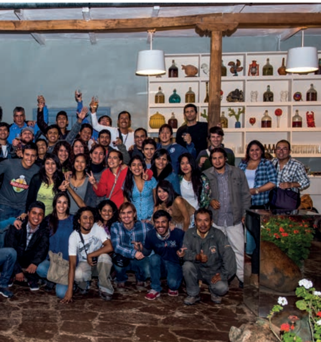
X Congreso Nacional de Ornitología