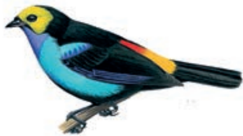
Tangara del Paraíso Tangara chilensis

Las observaciones de este grupo comenzaron a las 05:00 hasta las 12:00 horas en los sectores de Puerto Inca, Paucarcito, Sector Tzamire y el Mirador Pintuyacu.