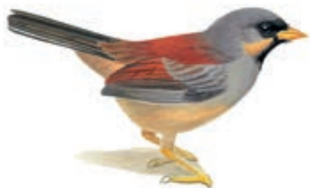
Fringillo-linca de frenillo anteado Inca spiza laeta

El GBD para el grupo 4 de los cajachos Birders empezó a las 06:00 horas y se prolongó hasta las 16:00 horas. Visitaron Llanguat, también conocidas con el nombre de Baños de Zendamal y ubicadas en Celendín.