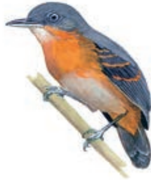
Horniguero de Allpahuayo Percnostola arenarum

El GBD de este pajarero comenzó a las 07:00 horas y se prolongó hasta las 15:00 horas entre los kilómetros 25 y 28 de la carretera Iquitos Nauta, abarcando hábitats de varillales, bosque primario, bosque secundario, orillas de quebrada.