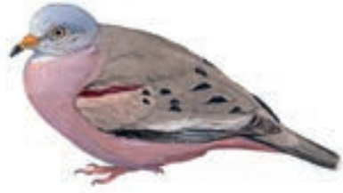
Tortolita Peruana Columbina cruziana

En el Parque de las Leyendas la observación de aves comenzó desde las 15:00 horas hasta las 17:45 horas.