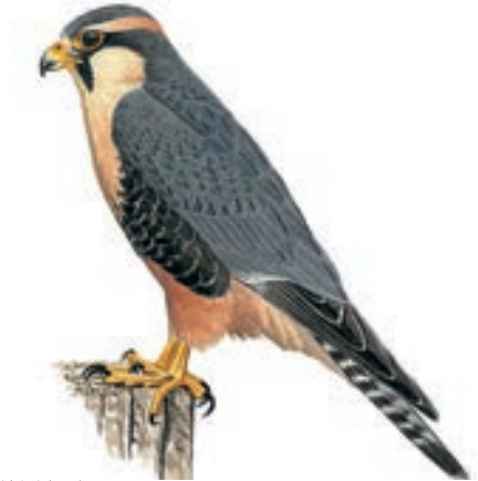
Halcón Aplomado Falco femoralis

Las observaciones se realizaron entre las 05:40 hasta las 18:30 horas. Los sitios recorridos fueron la Quebrada Chiguata, el bosque de Polylepis y matorrales vecinos Tuctunpaya y Uzuña.