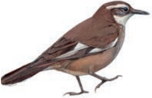
Churrete de Ala Blanca Cinclodes atacamensis

Se dio inicio al GBD en la plaza de Espinar, aun oscuro empecé a recorrer la plaza, para luego tomar la ruta a pie hacia la laguna Santo Domingo, posteriormente con movilidad del Sr Teodoro nos dirigimos a Suykutambo y Sachamayo. Las observaciones se realizaron entre las 05:00 y las 19:00 horas.