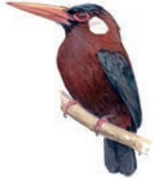
Jacamar de Oreja Blanca Galbalcyrhynchus leucotis

El GBD para los Bird Hunters empezó a las 07:30 horas y se prolongó hasta las 16:00 horas. En su recorrido visitaron bosques, zonas intervenidas y algunos ambientes acuáticos.