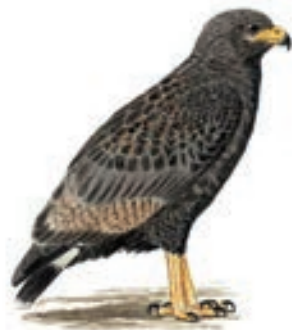
Common Black Hawk Buteogallus anthracinus