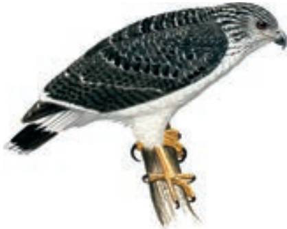
Gavián de Dorso Gríz Pseudastur occidentalis