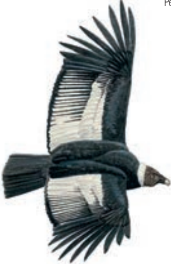
Cóndor Andino Vultur gryphus