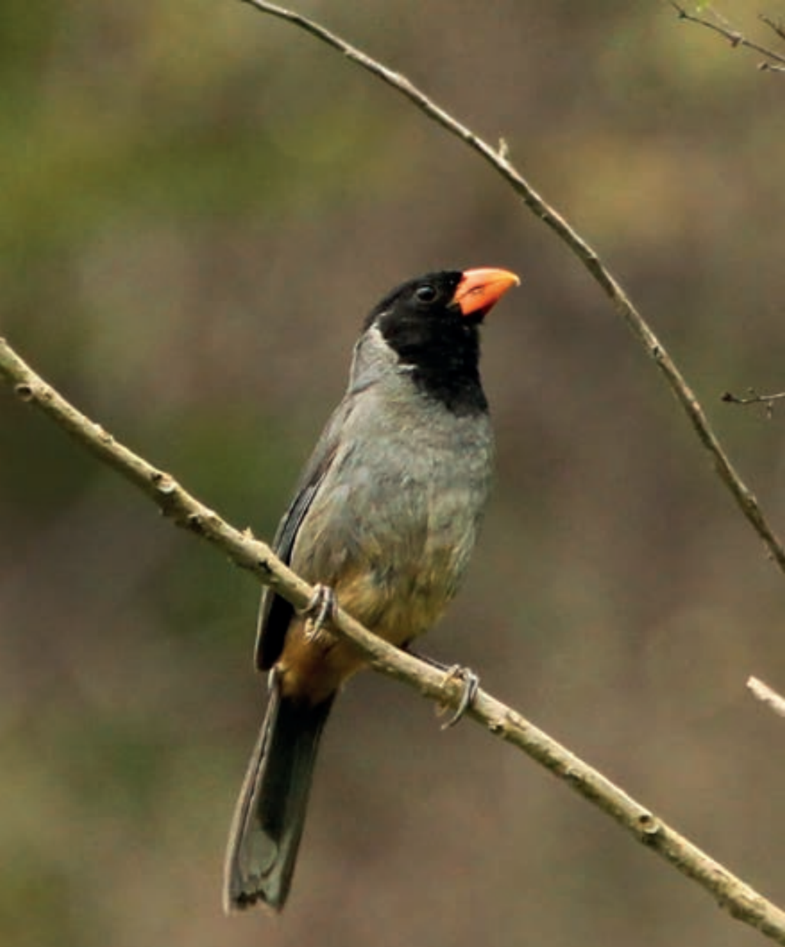
Black-cowled Saltator - Saltator nigriceps - Saltador de Capucha Negra