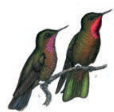
Colibrí de Neblina Metallura odomae