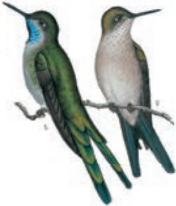
Cometa de Vientre Gris Taphrolesia griseiventris