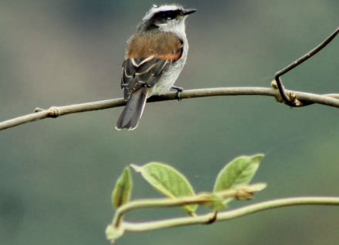
Piura Chat-Tyrant - Ochthoeca piurae - Pitajo de Piura