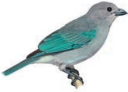
Tangara Azuleja Thraupis episcopus