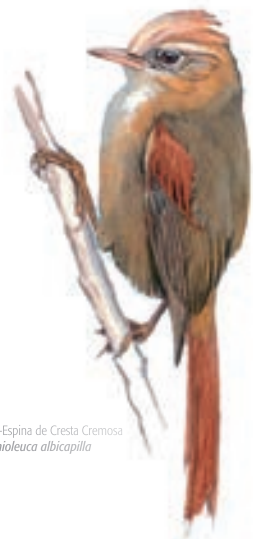
Cola-Espina de Cresta Cremosa Cranioleuca albicapilla

Empezamos muy temprano en el parque arqueológico de Sacsayhuaman para luego dirigirnos hacia la Comunidad de Huayllarcocha, continuamos por la quebrada de Tambomachay. Pudiendo apreciar así las lagunas de Queullacocha, Qoricocha para luego descender hacia la comunidad de Pukamarca, donde tuvimos la oportunidad de observar restos arqueológicos y también aves endémicas, y así llegar a Huchuy Qosqo donde finalmente retornamos al Cusco vía Písaq (en bus). Las observaciones las realizamos entre 05:30 y las 18: 00 horas.