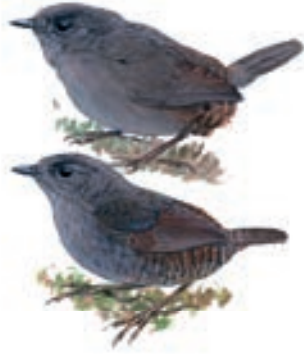
Páramo Tapaculo Scytalopus opacus

Debido a que el acceso a la zona en algunos casos se corta por las lluvias, decidimos partir de Piura el 12 de mayo y el 13 muy temprano hicimos contacto con las autoridades comunales para pedir los permisos necesarios e identificar las zonas de pajareo. Con un ojo abierto perpertamos a las 4 am del 14 de mayo salimos. Parecía que todo estaría bien, poco viento y algunas estrellas, sin embargo golpe de 5 am empezó a llover, el viento era muy fuerte y la niebla densa, el páramo en toda su naturaleza, así que muy mojados, continuamos todo el día.