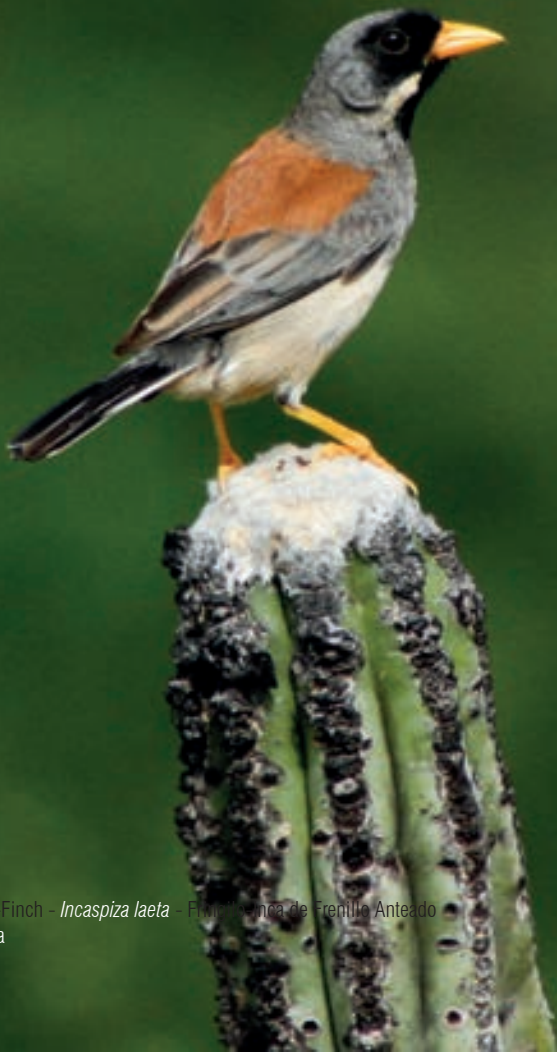
Red-billed Inca-Finch - Incafinca laeta - Frenillo Anteadado