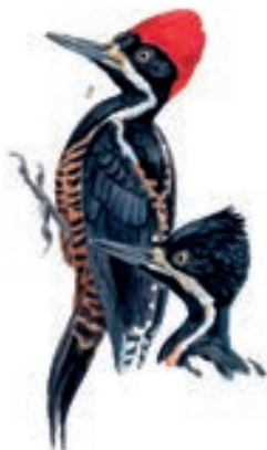
Carpintero Poderoso Campephilus pollens

Para el grupo 4 de los cajachos Birders el El pajareo empezó a las 06:30 horas, desde los límites del bosques de Huamantanga en un ecosistema de bosque montano húmedo hasta la ruta que comunica al Valle de Shumba en el distrito de Jaén, compuesto en el tramo de la ruta por bosques de transición entre bosque montano húmedo y bosques estacionalmente seco del Marañón hasta culminar en un valle con arrozales y restos de bosques seco.