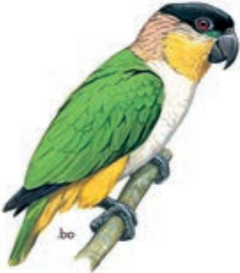
Loro de Cabeza Negra Pionites melanocephalus