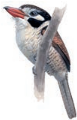
Buco de Oreja Blanca Nystalus chacuru

Las observaciones se realizaban entre las 05:00 y las 18:00 horas. El primer lugar visitado fueron los bosques y matorrales secos del cañón del río Pachachaca a aprox. 1900 m.s.n.m., inclusive el puente colonial Pachachaca. En la tarde y después de un viaje de varias horas – como estaban trabajando en la trocha, no había paso durante varias horas – nos quedaba solamente una hora antes del ocaso para observar aves en el primer parche (llamado “Kuchomonte”) - el más cercano a la trocha carrozable – de los bosques de Polylepis en el área de Rontocococha-Morococha (al sureste de la ciudad de Abancay), a unos 4100 m.s.n.m.