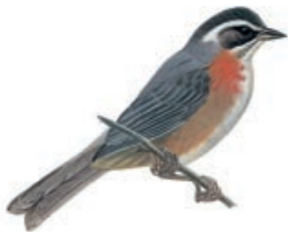
Monterita de Cola Simple Poospiza alticola

Este equipo observó 56 especies de aves, y realizaron 3 listas. Entre las especies de interés se registraron varias especies endémicas de Perú como: Cranioleuca baroni , Incapiza personata , Leucippus taczanowskii , Leptasthenura pileata , Metallura phoebe , Poospiza alticola , Upucerthia validirostris , Scytalopus affinis , entre otras especies de aves.