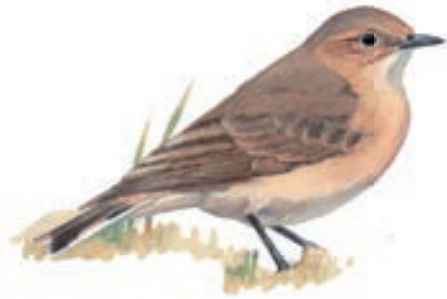
Colibri Negro Metallura phoebe

El GBD para los Koperdraad empezó a las 06:30 hasta las 17:00 horas. Su recorrido fue por la carretera entre Viñak, departamento de Lima y la Laguna Tipicocha, departamento de Huncavelica.