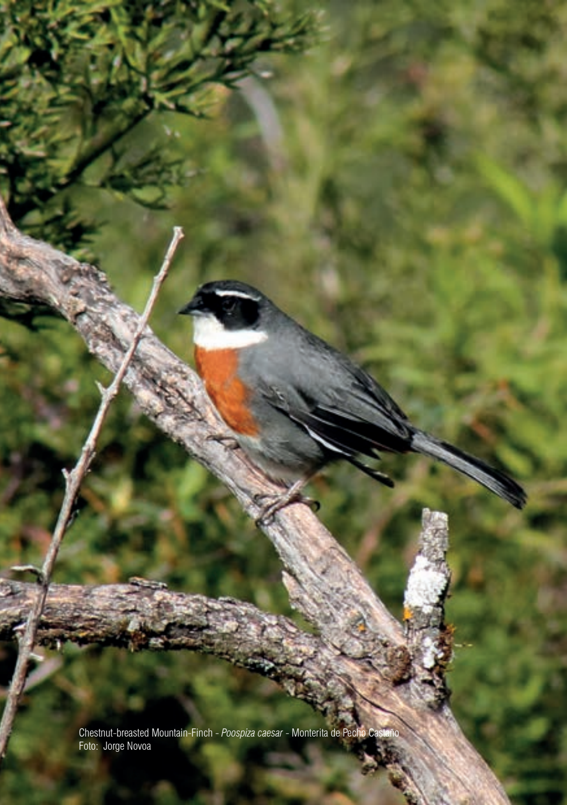
Chestnut-breasted Mountain-Finch - Poospiza caesar - Monterita de Pecho Castaño