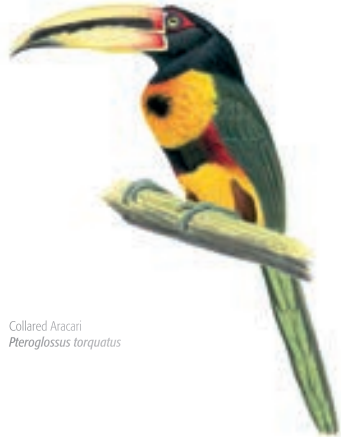
Collared Aracari Pteroglossus torquatus