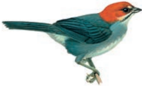
Matorralero de Apurímac Atlapetes forbesi