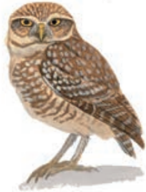
Lechuza Terrestre Athene cucularia

El GBD para este grupo empezó a las 06:15 horas y se prolongó hasta las 13:45 horas. Ellos observaron aves en la carretera Pachacamac - Cieneguilla, por el tramo del Puente Manchay, en Cieneguilla en el IEP Miguel Ángel.