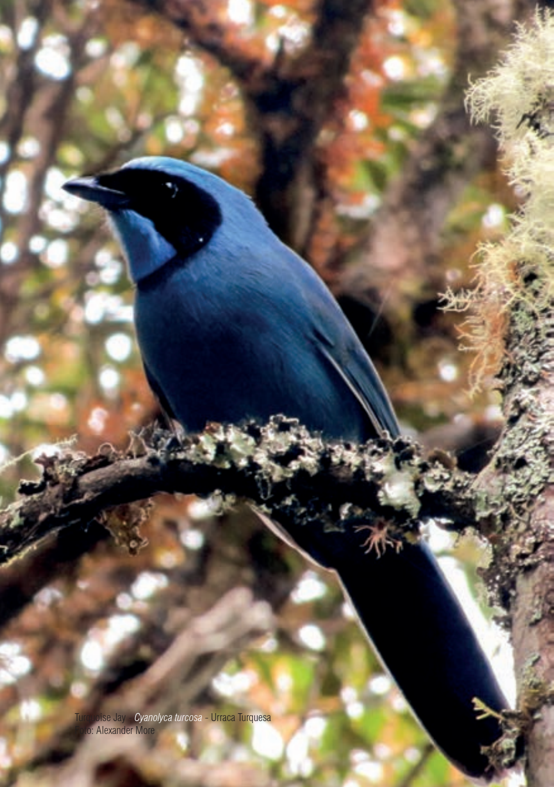
Turquoise Jay - Cyanolyca turcosa - Urraca Turquesa