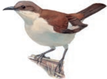
Churrete de Vientre Blanco Cinclodes palliatus

El GBD para este grupo empezó a las 10:00 horas y terminó a las 13:15 horas. Su recorrido incluyó matorrales, bosque y ambientes acuáticos de la reserva.