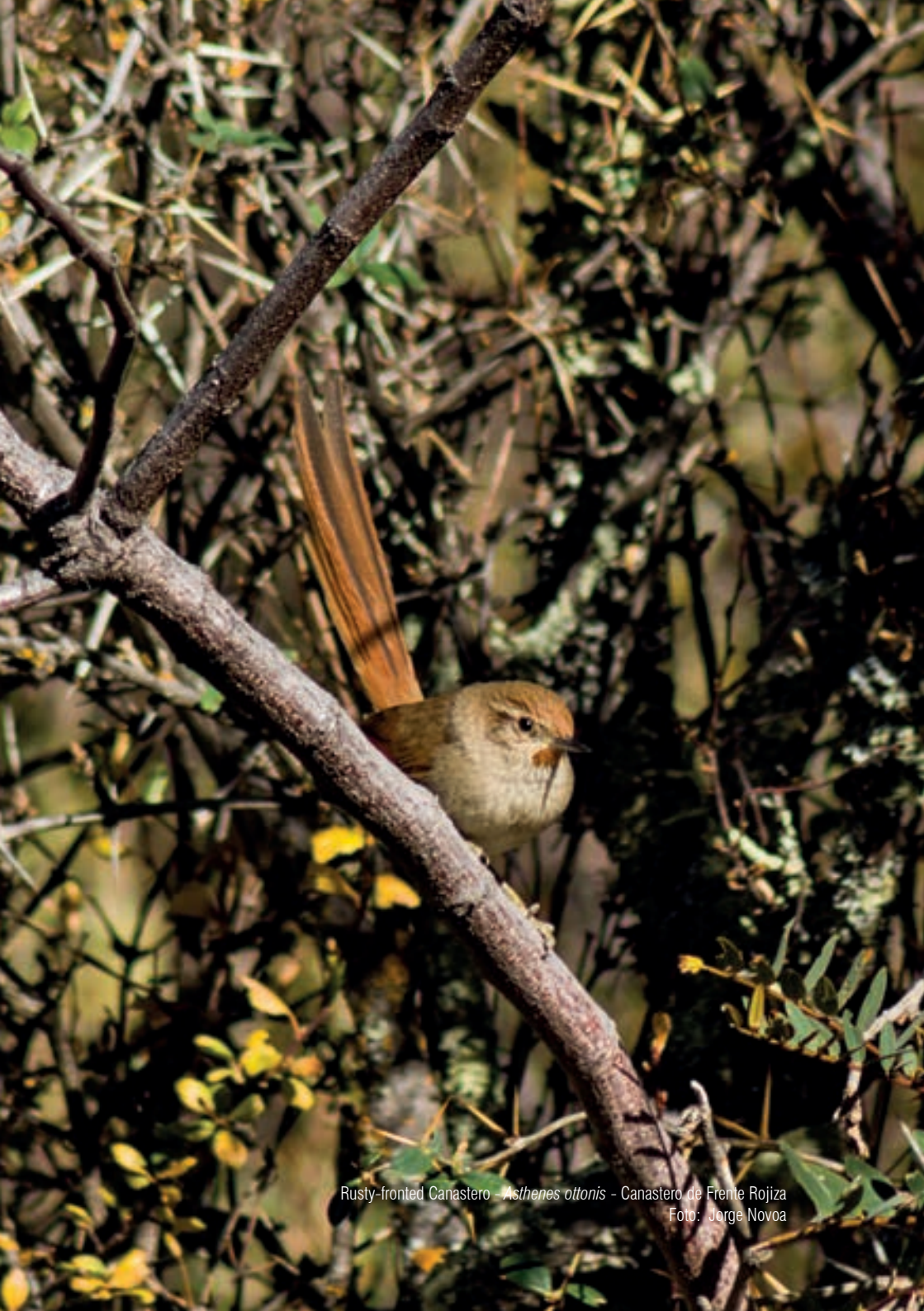
Rusty-fronted Canastero - Asthenes ottonis - Canastero de Frente Rojiza