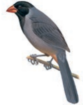
Saltador de Capucha Negra Saltator nigriceps

Salimos de Chiclayo y empezamos a ver aves en el Paramo que está entre Lambayeque y Cajamarca. Exploramos varios sitios en esta zona, y por la tarde, bajamos rumbo a Chiclayo, haciendo paradas en sitios con vegetación, entre este Paramo y la parte baja del pueblo de Llama, a unos 1800 m.