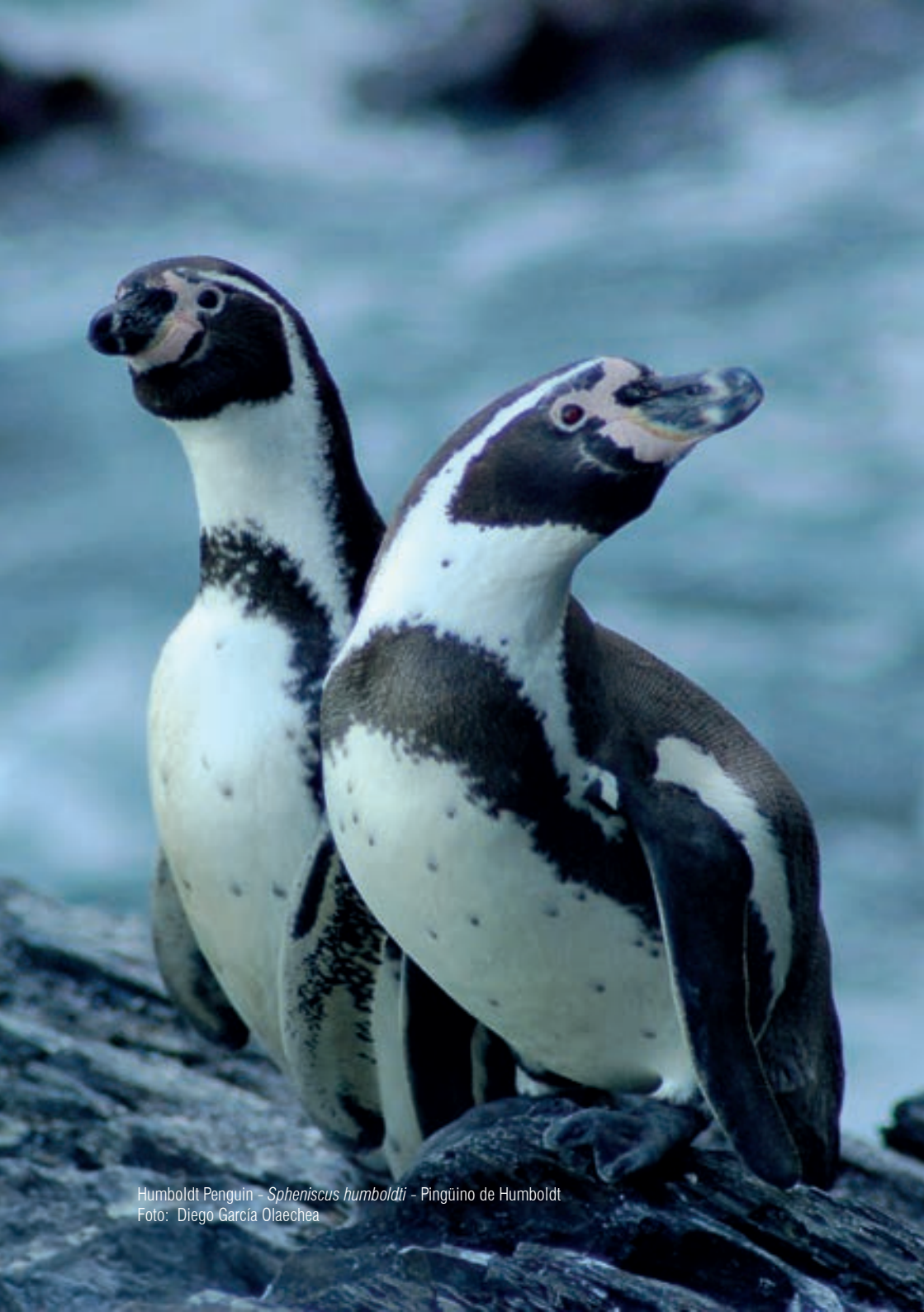
Humboldt Penguin - Spheniscus humboldti - Pingüino de Humboldt