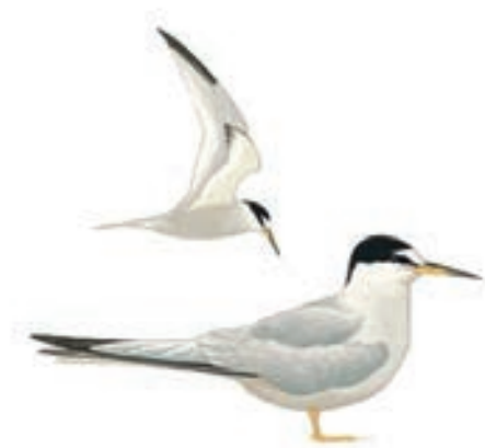
Gaviotín Peruano Sternula lorata