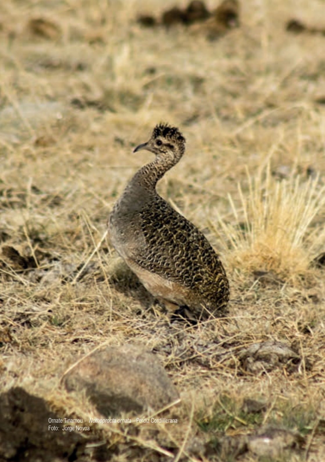
Ornate Tinamou - Nothoprocta ornata - Perdiz Cordillerana