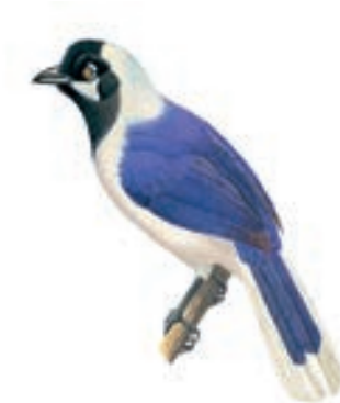
Urraca de Cola Blanca Cyanocorax mystacalis

Para nosotros, el GBG empezó a las 9:30 am y observamos aves hasta las 13 horas aproximadamente. Para llegar a Pomac la ruta es muy sencilla, se parte desde Chiclayo con tumbo a Pitipo, un distrito de la provincia de Ferreñafe.