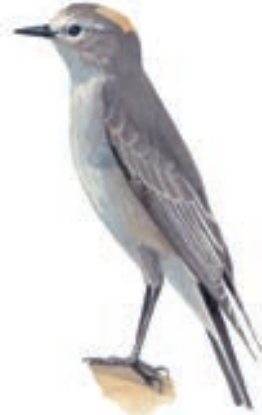
Dormilona de Nuca Ocrácea Muscisaxicola flavinuca

Las observaciones se realizaban entre las 07:00 hasta las 18:00 horas. El primer lugar visitado fueron los bofedales y pastizales altoandinos (a aprox. 4600 m.s.n.m) en las faldas del Apu Ausangate. El segundo lugar fueron los bosques (inclusive relictos de Polylepis sp.) y matorrales ( Puya spp., etc.) al borde del río Chillcamayu (a aprox. 4200 m.s.n.m. En todo este transecto se observaron especies de aves típicas para los Altos Andes.