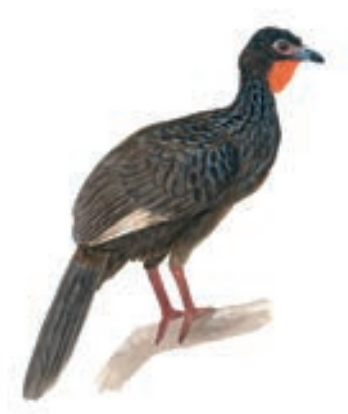
Pava de Ala Blanca Penelope albipennis