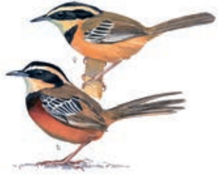
Marañón Crescentchest Melanopareia maranonica

Este grupo inicio muy temprano, minutos antes de las 5 am, en el Parque Infantil de la ciudad de Chiclayo y nos dirigimos a nuestra primera parada, en el Bosque de Pomac, luego nos dirigimos al abra porculla y terminamos en el Bosques de Yanahuanca para observar especies de distribución restringida al Valle del Marañón.