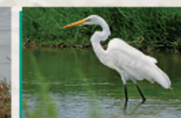
Garza Blanca Grande ( Ardea alba )