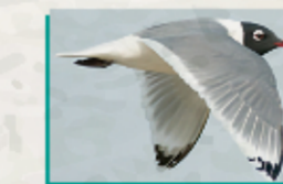
Gaviota de Franklin ( Leucophaeus pipixcan )