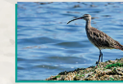
Zarapito Trinador ( Numenius phaeopus )