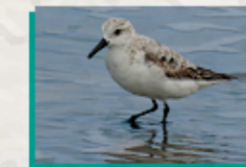
Playero Arenero ( Calidris alba )