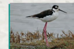
Cigüeñuela ( Himantopus mexicanus )